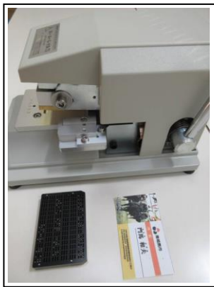
プレートをプレス機にセット